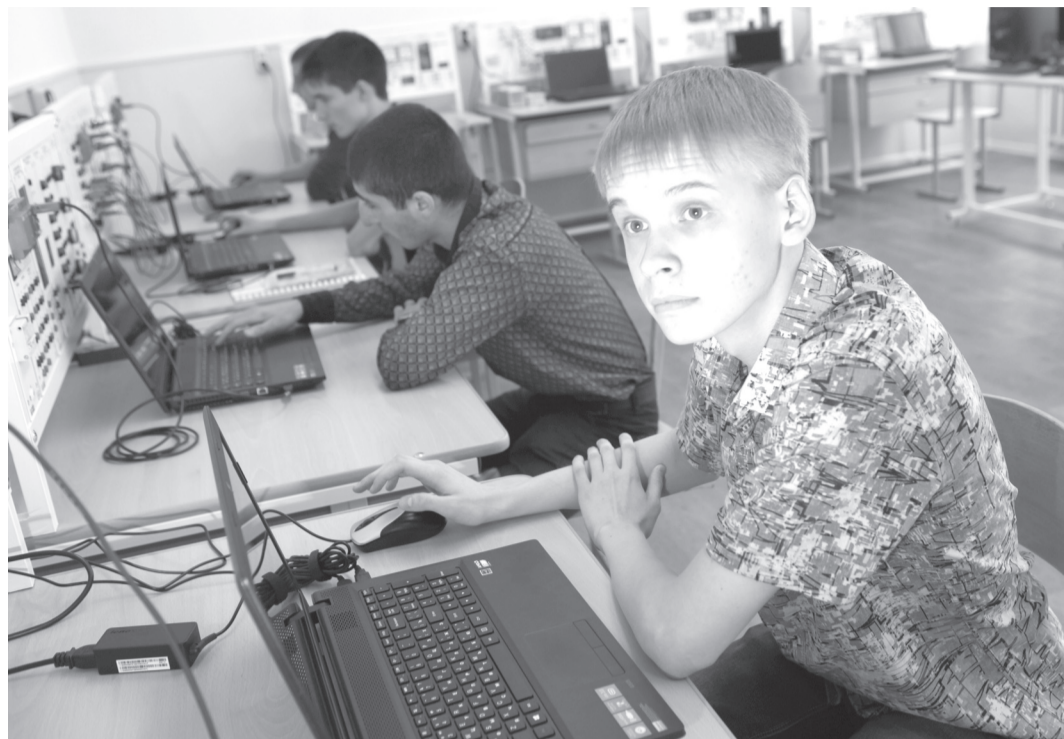
Раньше в лабораториях стояли громоздкие комплекты, включающие в себя осциллографы, генераторы и прочее, сейчас все это заменяет один электронный блок, сведения с которого поступают сразу на компьютер. С помощью этого оборудования можно научить студентов работе с новыми приборами, которые используются в современном самолетостроении

Свой вклад в техническое перевооружение ульяновского колледжа внес и завод «Авиастар-СП»,