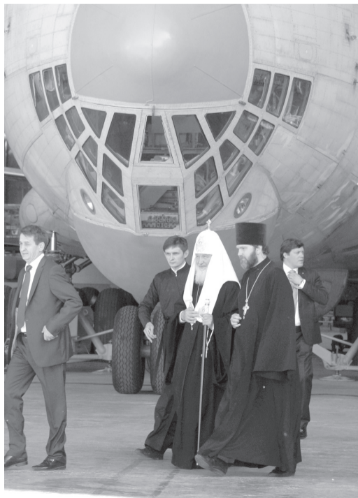
Именно ВС № 0105 осмотрел во время своего визита на «Авиастар» патриарх Кирилл

На сегодня на «Авиастаре-СП» в разной степени готовности находится еще десять самолетоконструктов, полное исполнение контракта с Минобороны намечено на конец 2020 года.